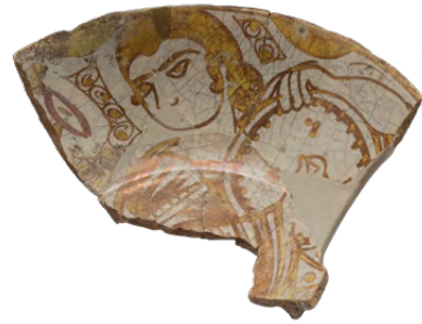
قشرة (جزء)، ٩٨٦- ١٠١٥، الفسطاط/مصر