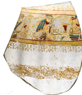
زجاج (جزء) ، القرن الثالث عشر، سوريا