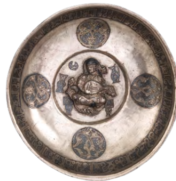
طبق فضي، القرن الحادي عشر، إيران