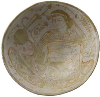
قشرة، القرن حاديه عشر، الفسطاط/مصر