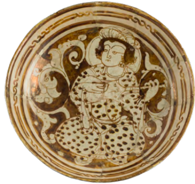
طبق، حوالي ١٢٠٠، إيران