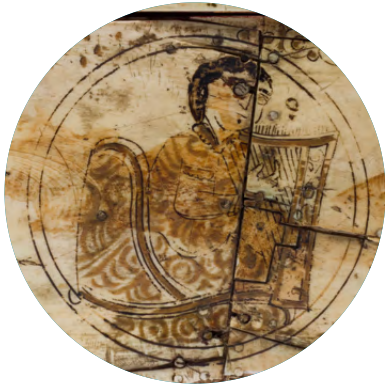
مربع عاج (تفاصيل)، القرن الثاني عشر، صقلية / إيطاليا

إبحثوا عن صورة وإسألوا أنفسكم، كيف كانت تسمع الموسيقى في ذلك الوقت، في أي مناسبة كانت تعزف؟