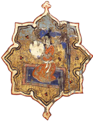
خشب مطلي، حوالي ١٦٠٠، حلب/ سوريا