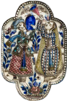
بلاطة، حوالي ١٨٤٠، إيران