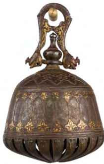
آلة موسيقية، القرن السادس عشر، إيران