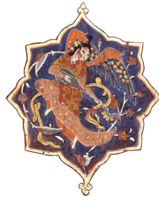
خشب مطلي، حوالي ١٦٠٠، حلب / سوريا