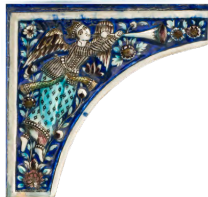
بلاطة، حوالي ١٨٤٠، إيران