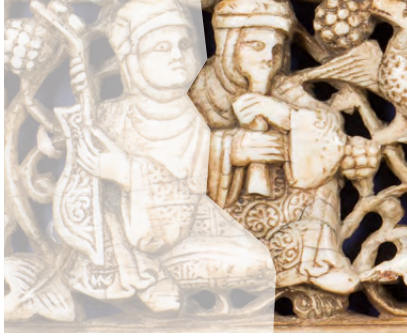
لوحات عاج (تفاصيل)، القرن الثاني عشر / الحادي عشر، صقلية / إيطاليا