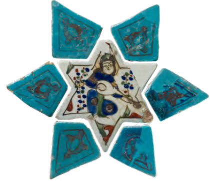
بلاطة النجمة، القرن الثالث عشر، كونية/تركيا