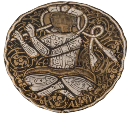
حوض معدني، ١٢٧٥ - ١٢٥١، الموصل/ العراق