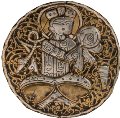
حوض معدني، ١٢٧٥ - ١٢٥١، الموصل/ العراق