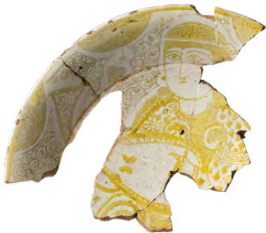
قشرة (جزء)، القرن حاديه عشر، الفسطاط/مصر