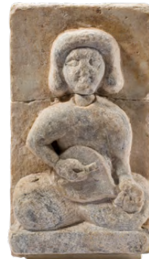
نقش بارز، القرن الثالث عشر، تركيا