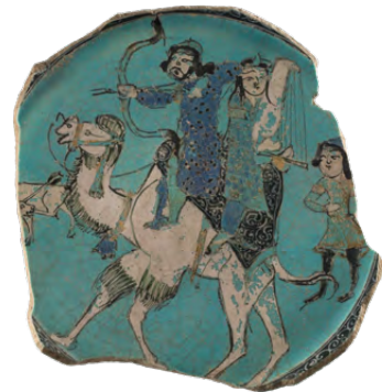
أرضية وعاء، حوالي ١٢٠٠، كاشان/إيران