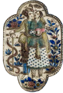
بلاطة، حوالي ١٨٤٠، إيران