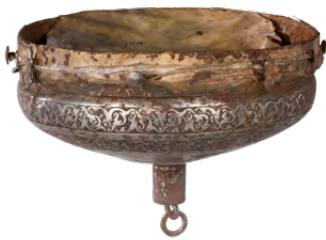
آلة موسيقية، القرن الثامن عشر / السابع عشر، تركيا