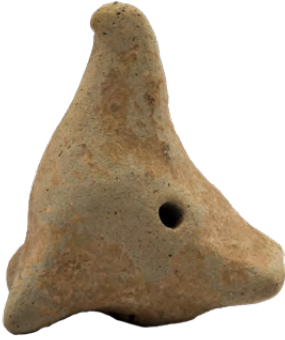
آلة موسيقية (طين)، القرن الرابع عشر / الثالث عشر أواخر، إيران