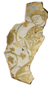
قشرة (جزء)، القرن حاديه عشر، الفسطاط/مصر