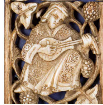
لوحات عاج (تفاصيل)، القرن الثاني عشر / الحادي عشر، صقلية / إيطاليا