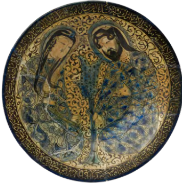
طبق، حوالي ١٢٠٠، إيران