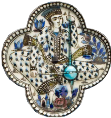
بلاطة، حوالي ١٨٤٠، إيران