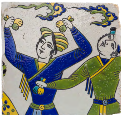
بلاطة، القرن السابع عشر أواخر، إيران